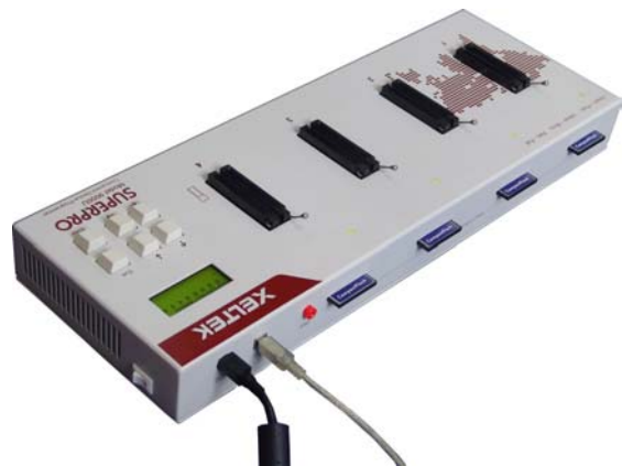
Rückansicht des SUPERPRO 9000U

Programmiergerät, 4 Compact Flash Karten, AC-Adapter (110-240 V), USB Kabel, Software, Handbuch, Transportkoffer